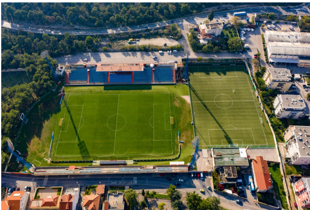
Slika 1. Stadion Šubićevac