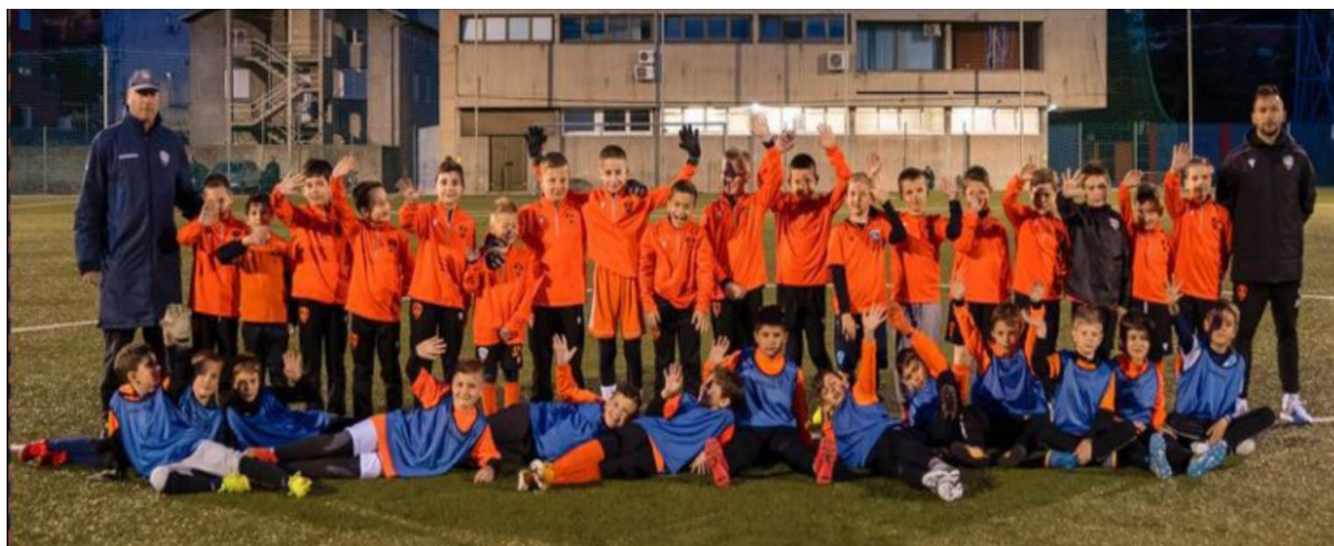
Slika 4. „Škola nogometa“ HNK Šibenik s.d.d.

Osigurati jasan postupak prijavljivanja incidenata u kojima je narušena sigurnost ili dobrobit maloljetnika te da se sve osobe koje sudjeluju u radu kluba informiraju o navedenom postupku.