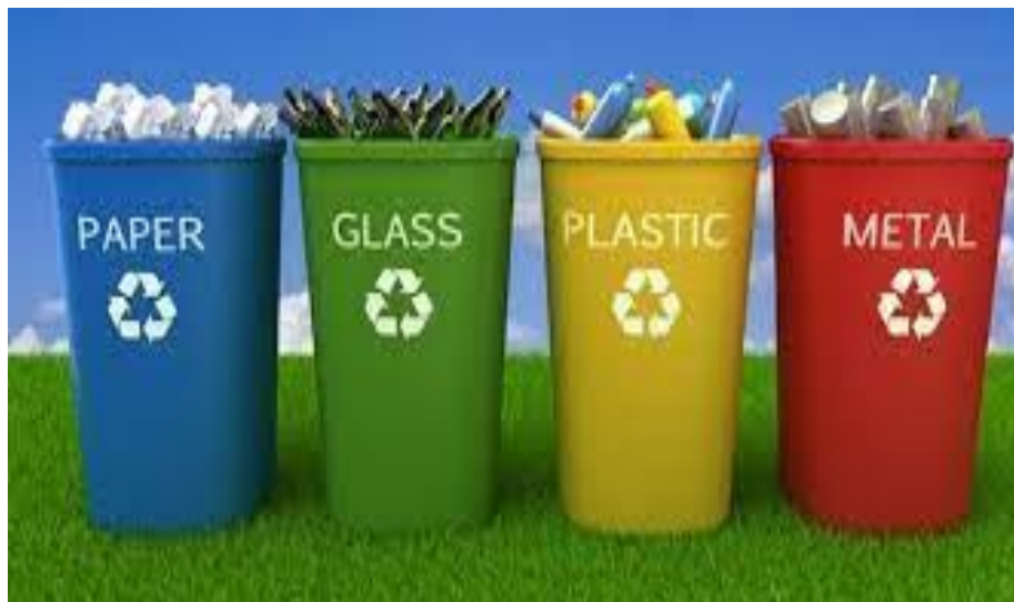
Slika 6. Recikliranje otpada