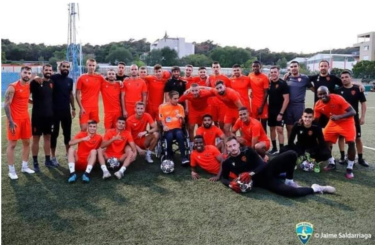
Slika 5. Fotografija sa treninga HNK Šibenik s.d.d.

Cilj ove politike je povećanje aktivnosti kluba osoba s invaliditetom, djece sa poteškoćama u razvoju i ostalih ugroženih skupina kao i starije populacije stanovnika u cilju povećanja njihovih redovnih fizičkih aktivnosti i time utjecaj na njihovo zdravlje.