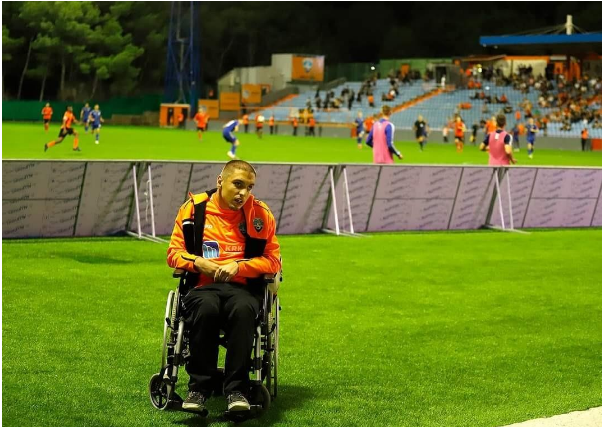
Slika 2. Fotografija sa prvenstvene utakmice

prava i prilike budu omogućeni svakom pojedincu uključenom u nogometne aktivnosti, duhu slobode i pravde.